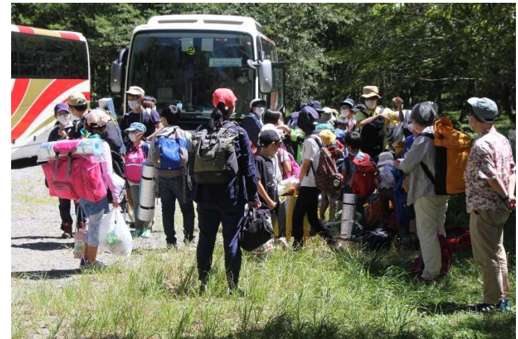
あそぼうキャンプ(8/14~16)